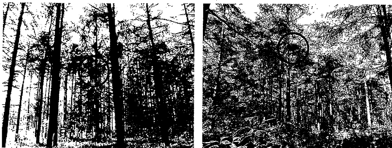
図3 ノスリ(左)とオオタカ(右)の営巣木とその周辺環境 (黒い円の中には巣がある)