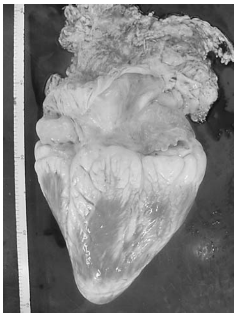
図3 心臓外観は、全体的に褪色しているほかにも異常を認めなかった。