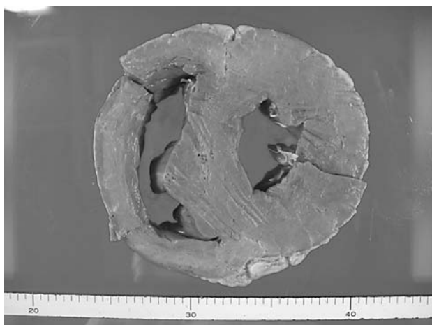
図4 心室の横断面。心筋の褪色と右心室壁の肥厚が認められた。

化といった、牛の拡張型心筋症と同様の組織所見が得られたため、本症例は心室腔の拡張を伴わない心筋症と診断された。ホルスタイン種乳牛の心筋症はほとんどが拡張型心筋症であることから [2] 、本症例はまれな症例であると考えられた。また、循環器症状を示しているものの、発熱、心室腔の拡張、心電図における低電位、血液検査における強い炎症像といった所見が認められない症例では、心室腔の拡張を伴わない心筋症を考慮する必要があることが示された。