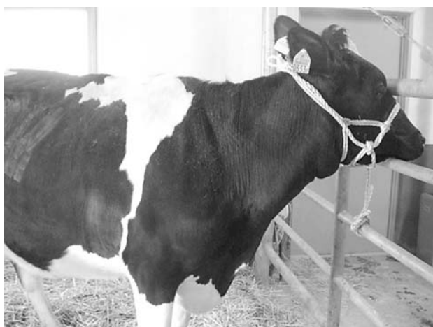
図1 下顎と胸垂の冷性浮腫が認められた (第19病日)

音の亢進・分裂が認められた (図2)。腹部エコー検査により中心静脈の拡張が認められたが、心エコー検査では心室の拡張は認められなかった。