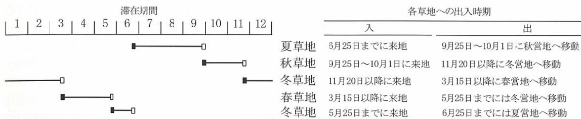
Fig.2. アシュリ・カザフ族郷における草地利用権の分配に伴って制限された各草地での滞在期間。

いよう、草地分配の組合せに関して牧畜民に1週間議論させた。草地利用権の抽選・決定した後、牧畜民グループ間で割り当て草地を交換することもできた。草地利用権を牧畜民グループに均等に分配するために、このように草地を等級分けしたのはアシュリ・カザフ族郷独自の手法であった。結局、一つの牧畜民グループに分配された草地面積は、夏草地、冬草地、春・秋草地それぞれ、1,000 畝 4) から 3,000 畝、平均 1,500 畝の割り当てとなった。