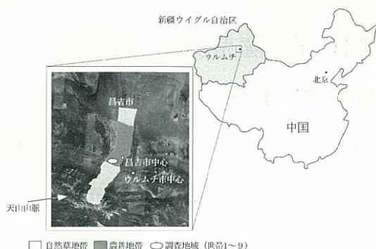
Fig. 1. 中国新疆ウイグル自治区昌吉市アシュリ・カザフ族郷の調査地域と自然草地・農耕地の分布。衛星画像の出典 Google Earth.

原センターで1990年代から2000年代前半にかけて所長を勤めたA氏に、家畜の世帯への分配、草地および農耕地の利用権の世帯への分配、草地での滞在期間の制限と家畜飼養頭数の制限について聞き取り調査をおこなった。アシュリ草原センターは、アシュリ・カザフ族郷を対象とした家畜と土地利用権の分配方法について、中央政府の基本方針に則って具体的に企画・実行する地方行政機関である。