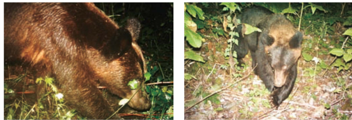
自動撮影カメラで撮影された河畔林を通過するヒグマ Brown bears passing through a riparian forest (photos captured by trail cameras)

A ccording to a newspaper report, brown bears tended to be spotted in Tokachi Region downtown areas more frequently every other year (specifically in 2015, 2017, and 2019). Recordings by trail cameras installed in and around riparian forests, through which brown bears move, revealed that the bears most frequently appeared in the Tokachi Region after hibernation (April through June) and before hibernation (November through December.) . They were usually observed from evening to early morning; therefore, staying away from rivers during these seasons and time periods will minimize the risk of encountering the bears.