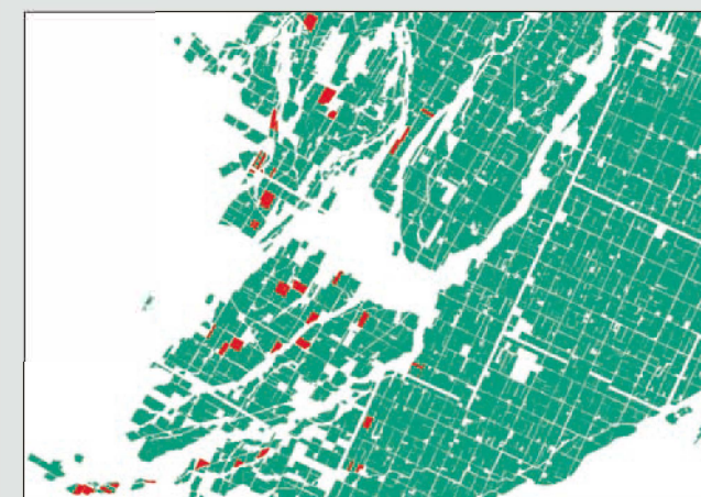
ヒグマの食害を受けた畑 (赤色部分) 被害箇所は河畔林に沿った畑が多い

B etween 2000 and 2021, at least 13 people were killed by brown bears, of whom 11 encountered the bears while picking edible wild plants or mushrooms. In the Tokachi Region, one person was killed by a brown bear while picking edible wild plants in Hironocho, Obihiro City, in June 2010; and another was killed in Akkeshi Town in the Doto area, in April 2021, in the same manner.