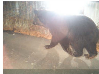
オーバーブリッジを利用するヒグマ Brown bear walking on an overbridge

智 恵や個性のあるヒグマとのトラブルを 100%抑える事は、難しい課題です。しかし、いつ・どこへ・どの時間帯や状況でヒグマが出没するということが分かっている、それを避ける、あるいは事前に遭遇の可能性を覚悟して、それに対する備えをする事でリスクを大きく減らす事が出来ます。