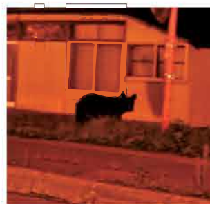
市街地に出没したヒグマ Brown bear spotted in a downtown area

T he latest Hokkaido government estimate is that 10,600 ± 6,700 brown bears inhabit Hokkaido; and 95% of the 173 cities, towns, and villages in Hokkaido who responded to a questionnaire reported that such animals had been spotted over the past five years, with 80% reporting that crops and livestock had been damaged by them.