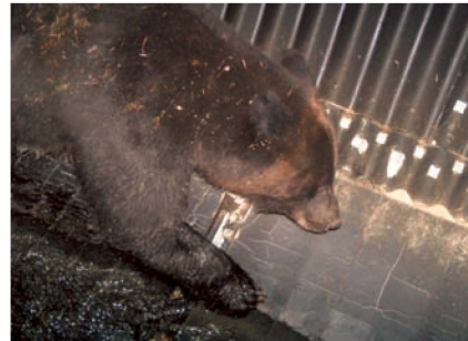
パイプカルバートを利用するヒグマ Brown bear crossing through a pipe culvert

C ollisions between brown bears and cars or trains, though infrequent, do occur. To facilitate the bears' passage and prevent such accidents, pipe culverts and overbridges have been installed along highways.