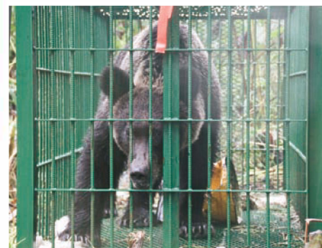
罠で捕獲されたヒグマ Brown bear captured in a trap

ヒ グマによる人身事故で死亡した人は、2000年から2021年までに少なくとも13人、そのうち11人が山菜、きのこ採りで熊に遭遇した人です。十勝地方では、2010年6月に帯広市広野町で山菜採りの人が1人亡くなっています。2021年4月には道東の厚岸町で山菜採りの人が襲われ、亡くなっています。