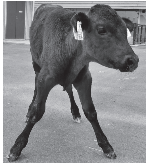
図1 第68病日の外貌所見 介助すると起立は可能であったが、開脚姿勢と体躯の動揺を呈し、歩行困難であった。

が、開脚姿勢が顕著で歩行できなかった(図1)。企図振戦はみられなかったが、立位で体躯の動揺がみられた。脳神経検査及び脊髄反射検査では、特に異常が認め