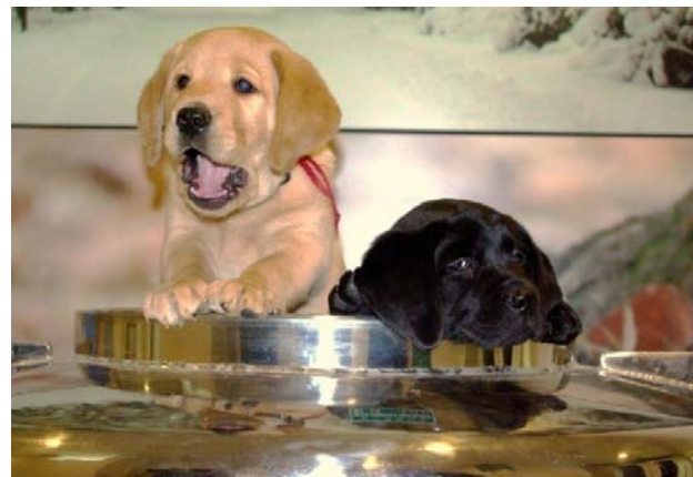
液体窒素から蘇った2頭のラブラドル