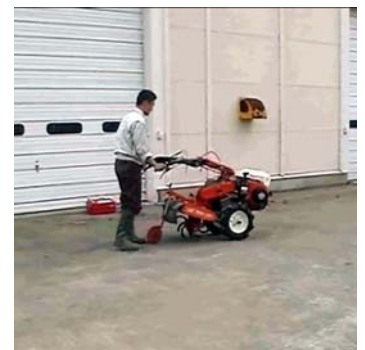
小型トラクタ走行試験