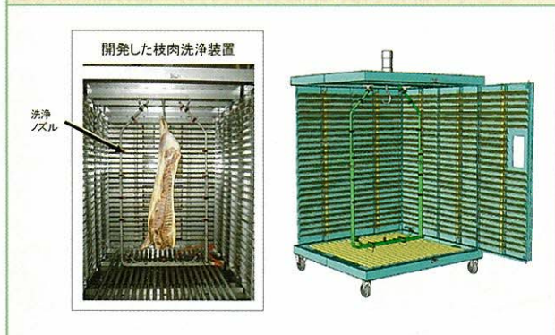
図1：洗浄ノズルの交換機能、圧力・時間の調整機能、上下の噴霧順位調節機能および洗浄汚水の跳ね上がり防止機能により高精度な枝肉洗浄が可能。