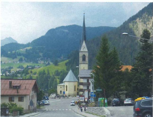
写真13 自然と調和した農村景観