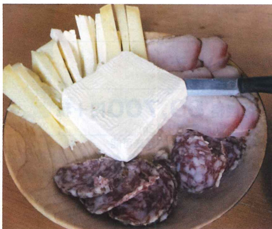
写真8 食卓の風景。山のチーズ、フレッシュ系チーズのトゼツラ、サラミと生ハムが並ぶ