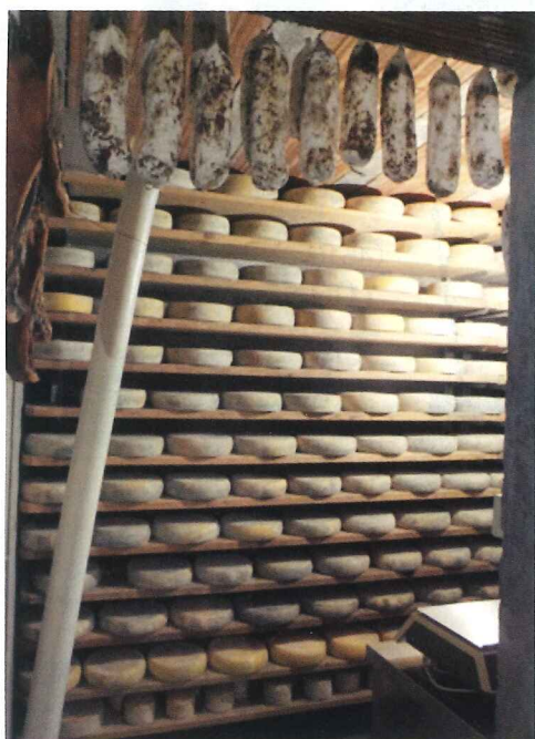
写真7 マルガの熟成庫。熟成中のチーズのほかにサラミが天井からつり下げられている

このままでもすぐに食べられますが、少し長く保存させるにはリコッタを薫製にします(写真10)。モミヤトウヒをチップにし、薫煙室で20日ほどいぶします。生乳を加熱する竈(かまど)の上に棚をつくり、その棚