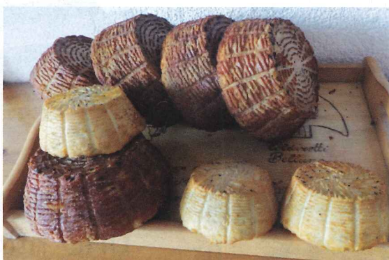
写真10 薫製リコッタ