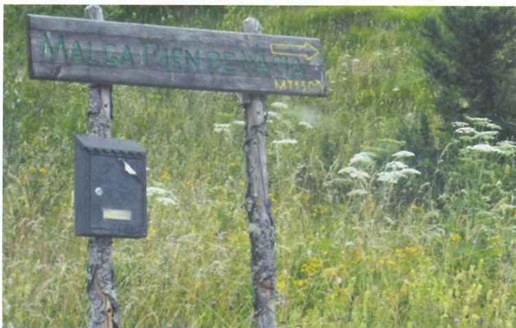
写真12 放牧地の野草。薬草と呼ばれるハーブ類を大切にしている

魅力的な牧場空間の創出、そして世代を超えて脈々と受け継がれる酪農。日本の酪農はイタリアから見習うところ大といえるでしょう。