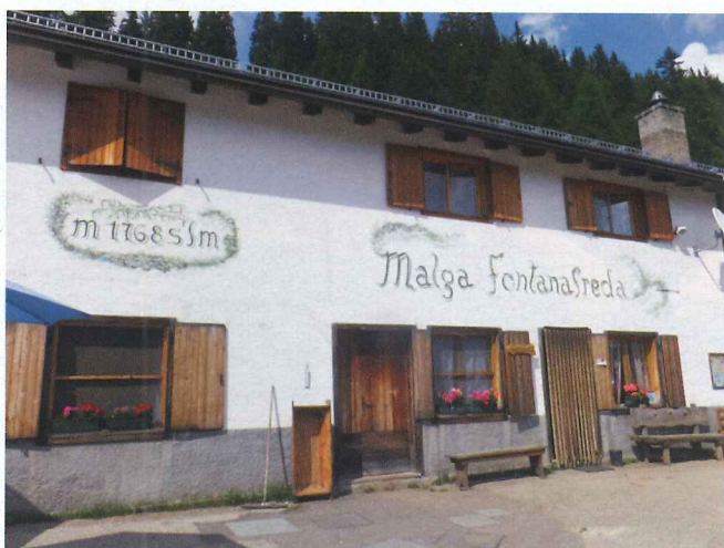
写真14 マルガのチーズ工房