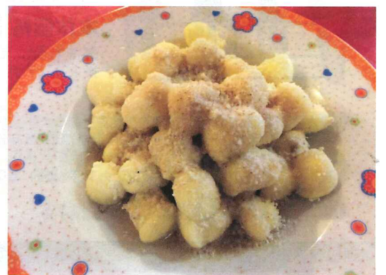
写真11 トウモロコシを練ってつくったニョッキの上ですりおろした薫製リコッタと溶かしバターが掛かっている