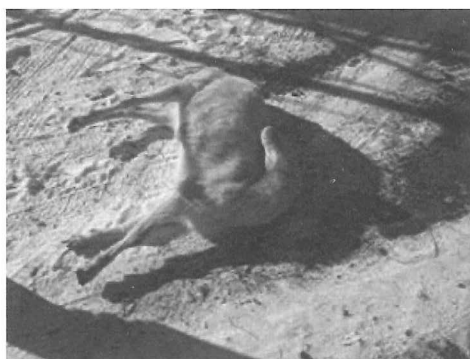
図4 リステリア症発症山羊にみられた神経症状。

クロストリジウム属 Clostridium perfringens による細菌感染症であり、消化管内増殖によりエンテロトキシンが産生され、消化管粘膜から吸収されて全身に広がる。飼料の変化、過食、運動不足などが原