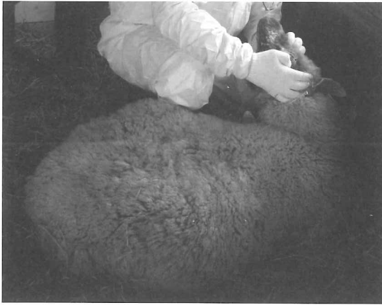
図3 分娩前のケトosis発症羊にみられた起立不能状態。

娠中毒症 (pregnancy toxemia)』と呼ばれている。また、「双胎病」といわれることもある。牛と同様、肝機能障害 (脂肪肝) が素因となる。臨床症状は食欲不振、元気消失、便秘、運動失調 (移動時の遅れ、逃げない、よろめく、もたれかかる、後駆麻痺)、神経症状 (震え、異常姿勢、歯軋り、起立困難、痙攣、昏睡) 等である (図3)。一般に急性では予後不良である。