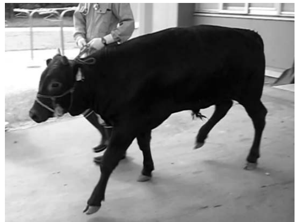
図1 症例は過剰な四肢の挙上，歩幅の増大等，測定過大を伴う歩様異常を呈していた（8カ月齢時）

搬入時，体温39.0℃，心拍数80回/分，呼吸数24回/分で，一般状態は良好であったが，開脚姿勢を呈し，歩行のふらつきと測定過大を伴う運動失調を認めた（図1）。脳神経検査では威嚇瞬き反応の低下を認めたが，歩行時に物にぶつかる等視力の異常を示唆する所見はみら