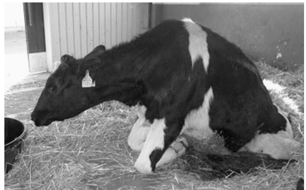
図1 症例は起立しようと前肢を動かすが、後肢に力が入らず起立不能を呈した(第16病日)。

搬入時、体温38.5℃、心拍数70/分、呼吸数30/分で、脱水、肺音粗励、起立不能が確認され、直腸検査では膀胱の拡張がみられた。自発排尿ができず少量の尿が少しずつ排泄される状態であった。排便は可能で、肛門反射が認められた。起立しようと前肢を動かすが、後肢に力が入らず起立不能であった(図1)。背部触診では脊椎骨の変形および圧痛は認められなかった。また、股