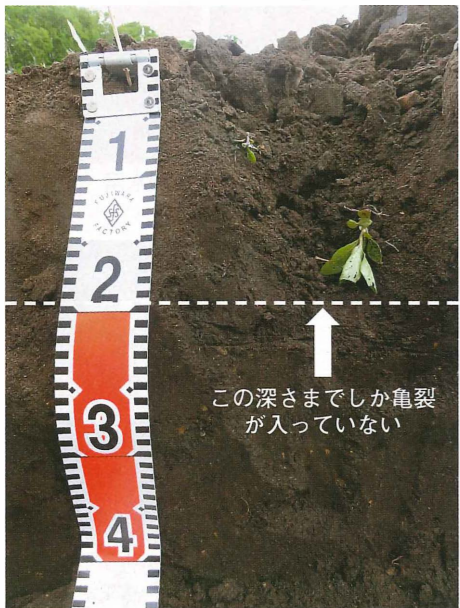
この深さまでしか亀裂が入っていない