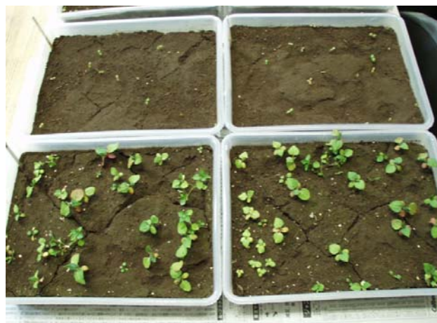
図1 帯広畜産大学実験圃場の土にカラマツの落葉を混和した場合(手前)と、しなかった場合(奥)の雑草発生の様子。

有機栽培では雑草の防除にかかる労力が大きな負担となっている。カラマツの落葉を活用することで、有機栽培における雑草防除の負担軽減が図れる。また、それまで利用されてこなかった地域資源に新たな価値を見いだせると期待できる。